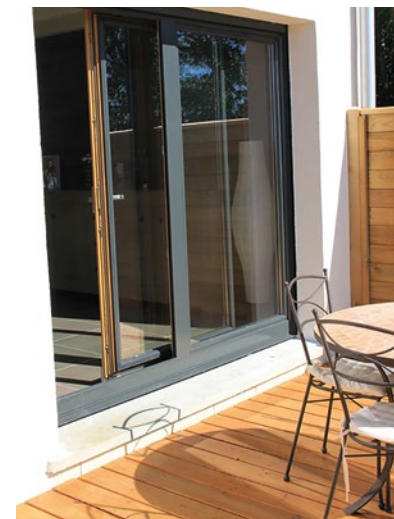
Finition Lasure 2 couches (selon nuancier) Peinture 2 couches (selon nuancier RAL)