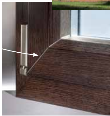
Profilé en chêne, bois exotique ou pin lamellé collé