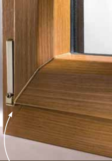
Insert doré ou argenté