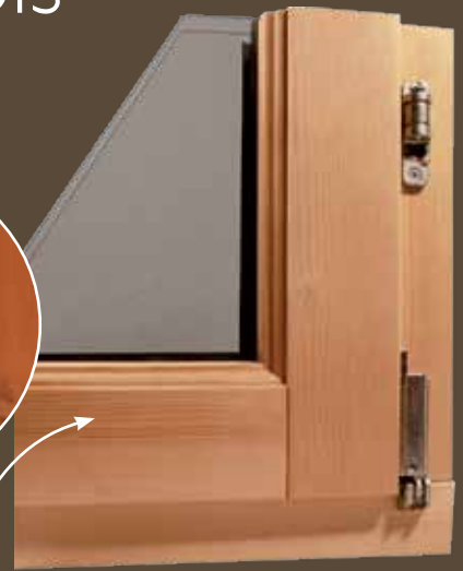
2 profils bois